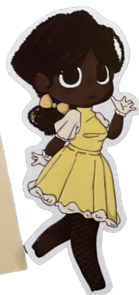
Auf dem iPad entstandenes Portrait einer Mitschülerin plus Sticker.